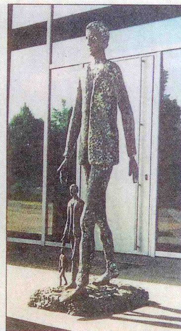
Drei Herren im gemäßigten Laufschritt: Roberto Barni schuf diese Skulpturen.